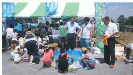
▲無料の水風船釣りなどを実施した

毎年恒例の「ながい水まつり/最上川花火大会」では、飲料水の安全安心と豊かな水環境を守る上下水道という基本的理念のもと参加。浄化槽カットモデルの展示や、無料のゲームコーナーにて広く市民の周知を図っている。