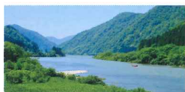
▲日本三大急流の一つ、最上川は、浄化槽の早急な整備が最も重要な課題となっている。

を変更した区域を有する市町村が多数あったこと。山形市をはじめ、米沢市、新庄市、上市市など、県内の計12市町村が、下水道整備区域の一部を浄化槽整備区域に変更することになった。